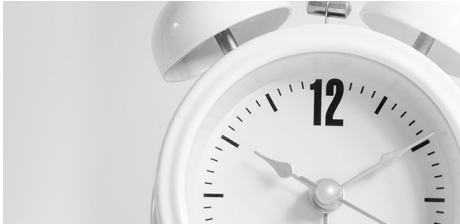
Tiempo y asistencia