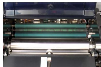
Fácil acceso para su mantenimiento