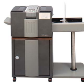
Procesamiento in-line para grandes volúmenes