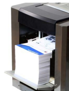
Bandeja de alimentación de gran capacidad para procesamiento off-line