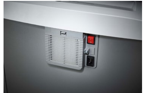
Destrucciona de documentos Top Secret Dahle 604air