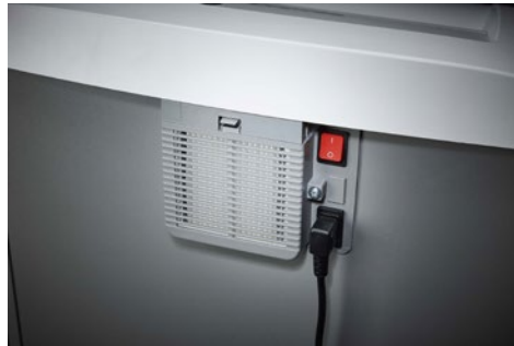
Destrucciona de documentos Top Secret Dahle 604air