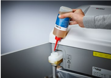
Destrucciona de documentos Top Secret Dahle 604air