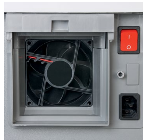
Un ventilador potente aspira las partículas de polvo fino directamente en el interior de la destructora y las transporta al filtro