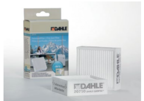
Filtros de partículas finas Dahle 20710