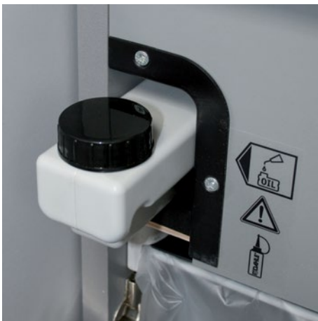
Depósito de aceite integrado para un lubricado automático controlado de los rodillos de corte cruzado que favorece una operatividad más prolongada con un rendimiento constante