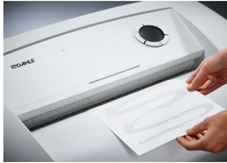
Destrucciona de documentos Office Dahle 416air