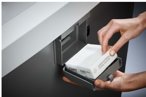
Destruccion de documentos Office Dahle 416air