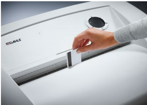
Destrucciona de documentos Office Dahle 416air