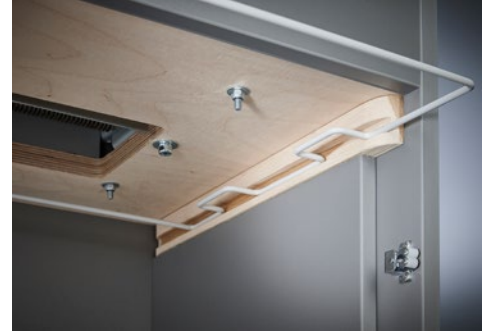
Destrucciona de documentos Office Dahle 416air