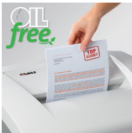
Cómoda destrucción, sin perder nada de tiempo con la lubricación de los rodillos de corte