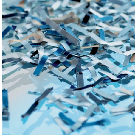
Nivel de seguridad P-4: Recomendado para soportes con datos particularmente sensibles, confidenciales y personales