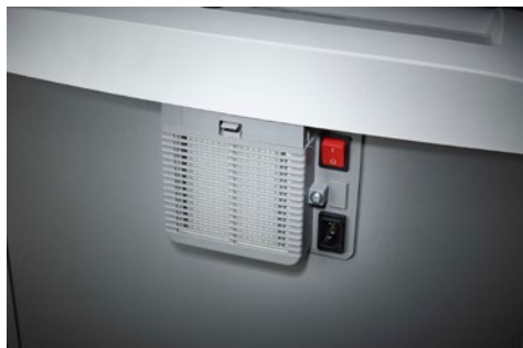
Destruccion de documentos Office Dahle 416air