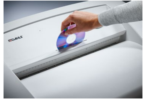
Destrucciona de documentos Office Dahle 416air