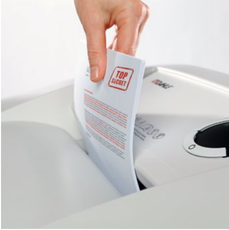
Una capacidad de destruccion hasta un 30% más elevada gracias a la innovadora tecnología MHP®