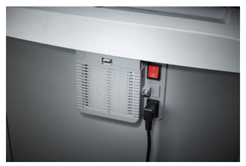
Destrucciona de documentos Office Dahle 416air