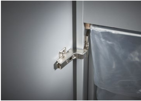
Destrucciona de documentos Office Dahle 416air