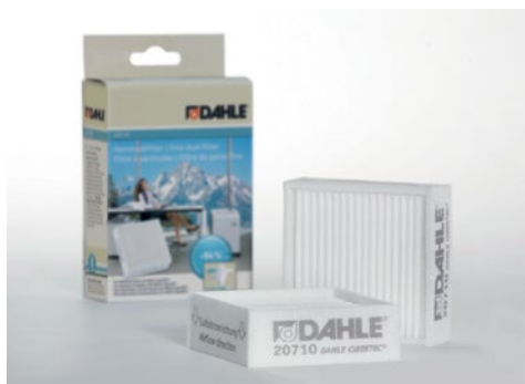
Filtros de partículas finas Dahle 20710