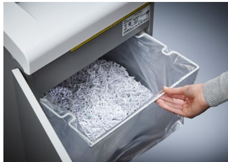
Destrucciona de documentos Office Dahle 416air