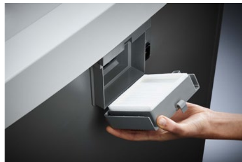
Destruccion de documentos Office Dahle 416air