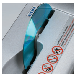
SEGUNDO CABEZAL DE CORTE

Aberturas separadas para la destrucción de CDs/DVDs con un segundo cabezal de corte. Fococélula para "start" y "stop" automático