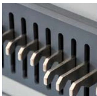
Puede seleccionar la anulación de las perforaciones.

Los sistemas RECO de encuadernación Changer PUNCH 1 y 2 son el aliado perfecto en las copisterías y centros de gráficos. La característica que destaca en las encuadernadoras Reco es su gran flexibilidad. Los robustos peines de perforación se pueden intercambiar en menos de 1 minuto. Son equipos recomendados para volúmenes medios de trabajo.