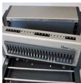
El cambio de tipo de encuadernación se realiza mediante el intercambio de peines, una tarea que podrá realizar en menos de un minuto.