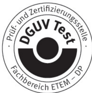
Signature (Dipl.-Ing. Vogl)

Further provisions concerning the validity, the extension of the validity and other conditions are laid down in the Rules of Procedure for Testing and Certification of August 2012.